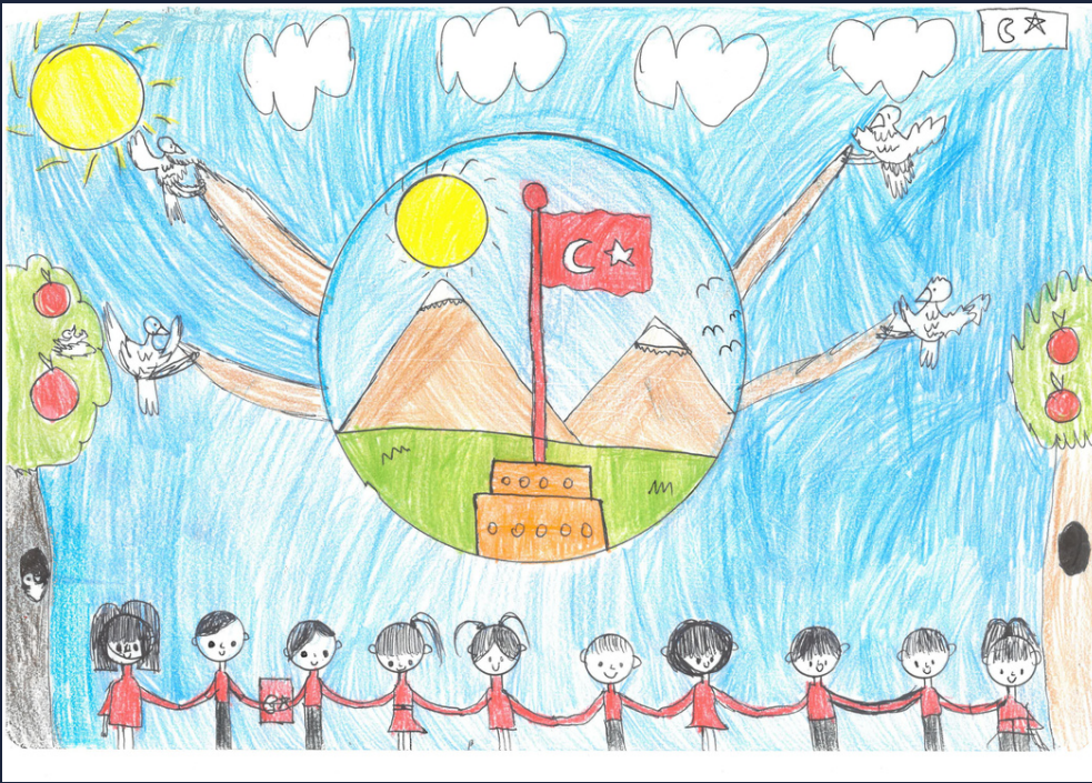
Dijle ŞAHİN 4/F